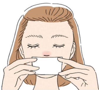
リップケアの前は、お湯で濡らしたコットンなどで唇を温めてからやると効果的♪