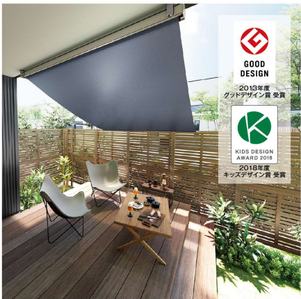
インディゴデニム