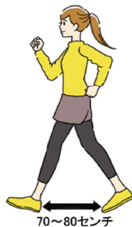
歩幅は広めの70〜80センチが良いそうです

骨に負荷をかけると、骨をつくる細胞の活性化につながるのですが、かかと落としも良いですよ。運動が苦手、という人はぜひやってみてください。