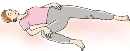
ストレッチは無理のない範囲で行いましょう

手を椅子などに添え、足は肩幅くらいに広げてまっすぐ立ちます。つま先立ちになり、重心をかけたなかからかかとを床につきます。これを1セットにつき10回、1日3セットがおすすめです。ほかに、仰向けに寝て膝を立てます。片足の膝を伸ばしてゆっくり持ち上げ、5秒ほどキープして元に戻します。これを片足5〜10回繰り返しましょう。