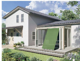
フォレストグリーン