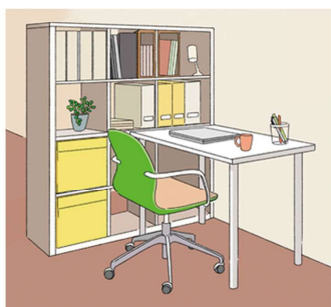
観葉植物や写真を飾るなど、好きなモノを凝縮させるのも素敵！

から使えるオープンな収納なら、上下、左右など、自分のスペース用、生活用という感じで使い分けられるのもできるので便利です。高さがあるほど、プライベート感が増しますし、たとえば、お子さんの様子が気になるな、ということなら、ある程度高さを抑えることで、ゾーン分けをしながら、まわりの様子もつかえます。 ちなみに、長時間座って作業をした