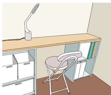
カラーボックス2つに天板を渡せば、省スペースで収納兼デスクが実現！

ブルを使えば、一石二鳥ですね。 ダイニングテーブルの一角を仕事や趣味スペースとして使う場合は、テーブルの上にモノを出しっぱなしにしないことが鉄則！モノが出しっぱなしになると、一気に雑多な雰囲気になり、食事をするにも邪魔になってしまいます。そこで、ダイニングテーブルのサイドや、背面に収納家具を置き、さらに、どこに何をしまおうか、分類できるようにすることで、必要なモノがすぐ出し入れでき、散らかり防止になります。 小さい空間でもいいから自分のスペースが欲しい！ということなら、奥行きが浅いコンソールテーブルや、壁面に設置でき、必要なときだけ使える折り畳み式のテーブル、はしご型の机などを活用するのも手です。収納と机が一体型になったライティングビューローもおすすすめ。ライティング