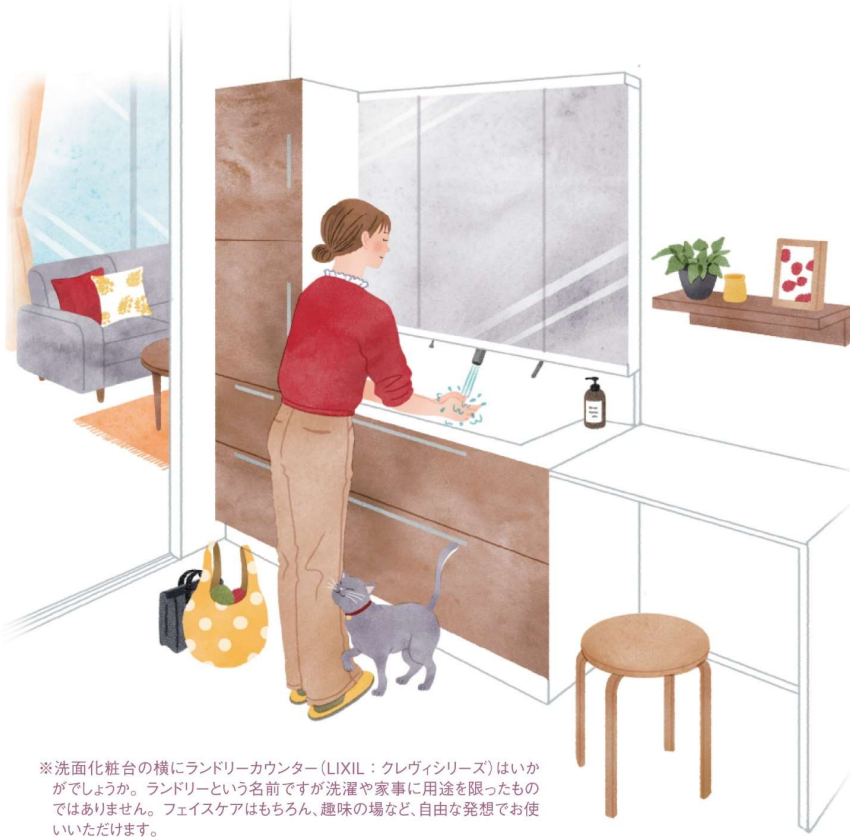
※洗面化粧台の横にランドリーカウンター(LIXIL:クレヴィシリーズ)はいかがでしょうか。ランドリーという名前ですが洗濯や家事に用途を限ったものではありません。フェイスケアはもちろん、趣味の場など、自由な発想でお使いいただけます。